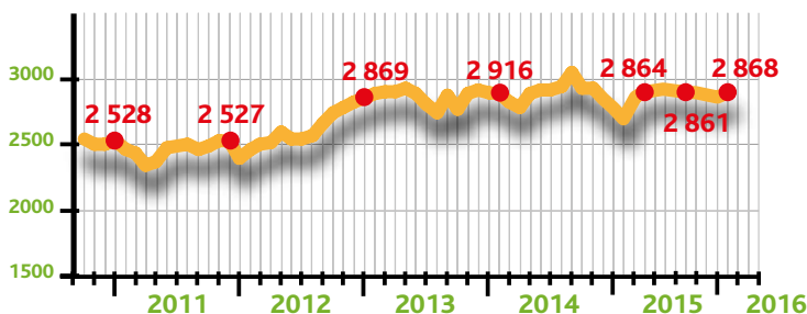
Évolution mensuelle des demandeurs d'emploi de catégorie A de la ZEP Vendôme

partielle et irrégulière a limité l'intérêt du consommateur. Le poissonnier du mardi a trouvé sa clientèle, mais bien trop seul. Le maraîcher bio du samedi a réussi son démarrage. Ce jeune créateur poursuivra.