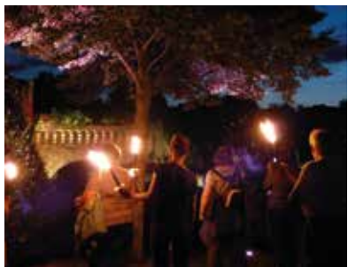
Visite aux flambeaux

Réservations et RV office de tourisme Limité à 40 personnes - Tarif : 5,45 €