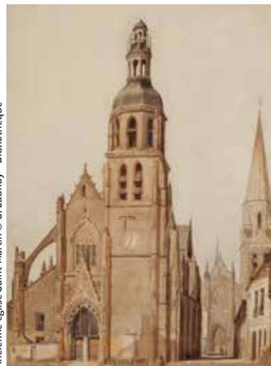
Ancienne église Saint-Martin

14 h 30 – RV office de tourisme – Tarif : 4,80 €