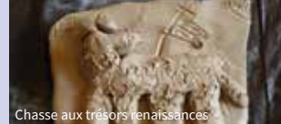
Chasse aux trésors renaissance

Un programme sera édité ultérieurement pour informer sur les visites, expositions et animations dans les communes de la communauté d'agglomération Territoires vendômois.