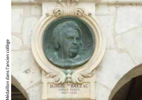
Medaillon dans l'ancien collège

14 h 30 – RV office de tourisme – Tarif : 4,80 €