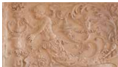
Détail gothique flamboyant

14 h 30 – RV office de tourisme – Tarif : 4,80 €