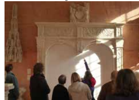
Tombeau de M. de Luxembourg – CIAP

14 h 30 – RV office de tourisme – Tarif : 4,80 €