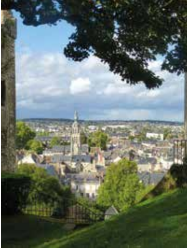
Vue sur la ville du château