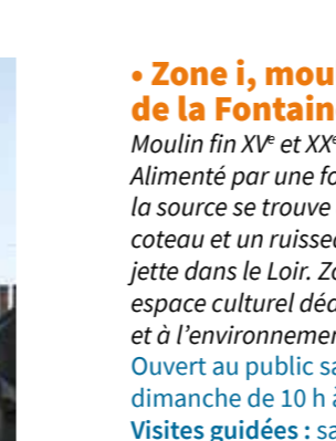
Moulin de la Fontaine