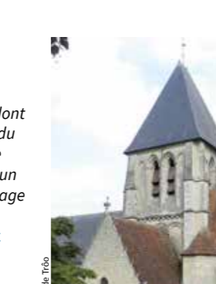
Collégiale Saint-Martin de Trôo