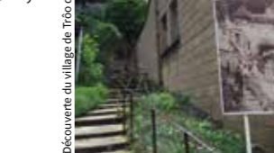
Découverte du village de Trôo d'hiver