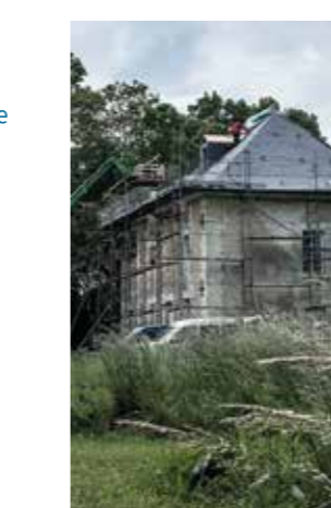
Moulin de la Fontaine