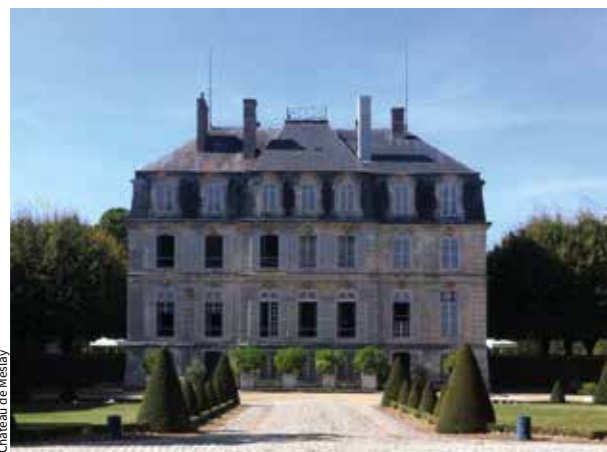
Château de Meslay

Visite guidée : église, village et château samedi à 14 h 30 9 personnes – RV : pont gothique – Durée : 2 h 30 – Tarif : 3 € adulte – Présentée par François Duval, bénévole de l'association Hist'Orius