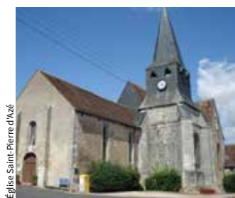
Église Saint-Pierre d'Azé

Ouvert au public samedi et dimanche de 8 h 30 à 18 h