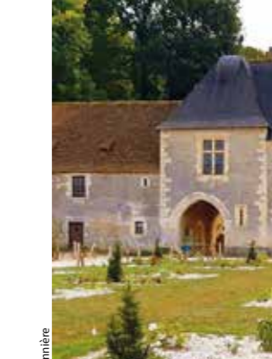
Manoir de La Possonnière