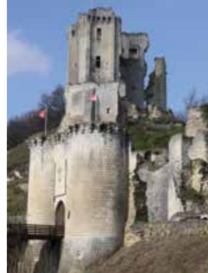
Château de Lavardin