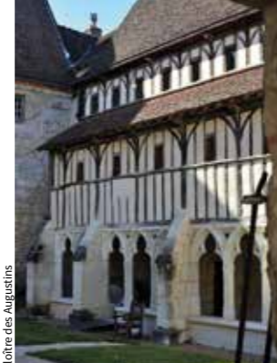
Château de Lavardin