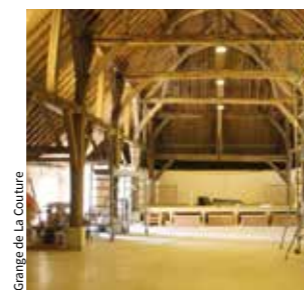
Grange de la Couture